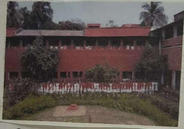
विद्यालय प्रार्थना भवन