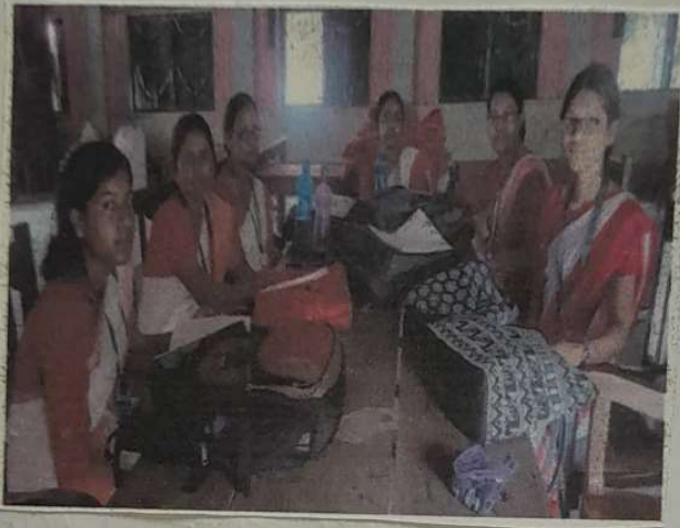
ବିଦ୍ୟାଳୟର ଅଧ୍ୟକ୍ଷାଙ୍କୁ ଆରମ୍ଭ