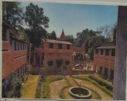
শ্রী রামকৃষ্ণ আঞ্চলিক উচ্চ বালিকা বিদ্যালয়